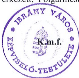
Trencsényi Imre Polgármester

Mivel más kérdés, észrevétel nem érkezett, Polgármester Úr megköszönte a Képviselő-testület munkáját, és az ülést bezárta.